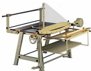
Abrollvorrichtung und Holztisch abklappbar