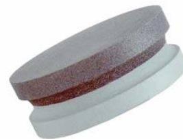
Handabziehstein für Messer